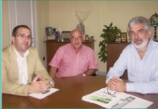
El Delegado de Empleo junto a los representantes de CEMPE