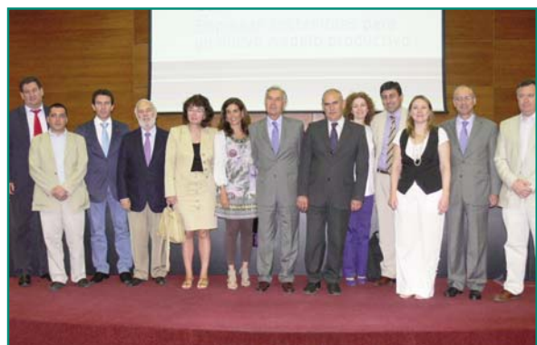
Miembros de CEPES ANDALUCÍA junto a las autoridades.