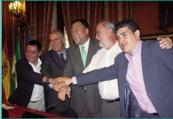
Representantes del Ayuntamiento de Sevilla junto al Presidente de CEPES ANDALUCÍA.