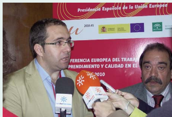
El Secretario General de CEMPE ANDALUCÍA y el Presidente de CIAE atienden a los medios de comunicación.

“Un colectivo que representa a la mayor parte del tejido empresarial de Andalucía debe salir fortalecido