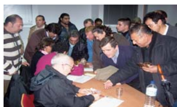
Asamblea en Alhaurín, 9 de Febrero